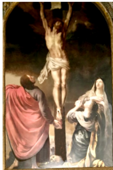
De kruisiging door W. Herreyns

De 'Heilige Familie met de papegaai' hangt nu in het Rubenshuis van Antwerpen.